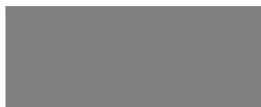
Graueffektsilber Sparkling grey metallic Gris argent métallique