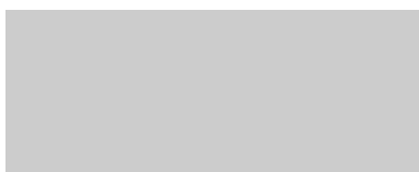
Brillantsilbermetallic Bright silver metallic Argent métallique clair